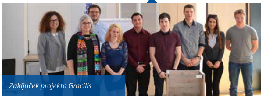
Zaključek projekta Gracilis