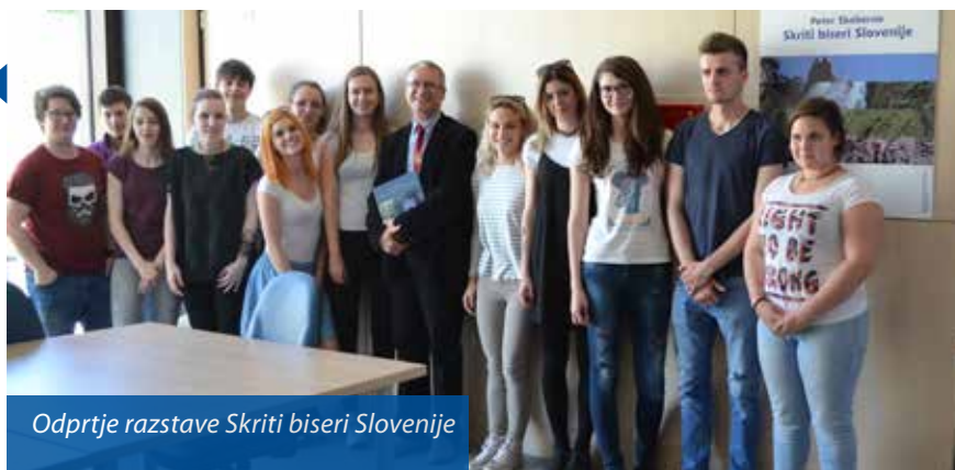
Odprtje razstave Skriti biseri Slovenije

|| 24. 5. je evropski dan parkov, ki smo ga obeležili s strokovno vodenim ogledom velenjskega mestnega parka , ki ga je pripravila naša predavateljica in krajinska arhitektka Saša Piano (prireditev v sklopu Tedna vseživljenjskega učenja).