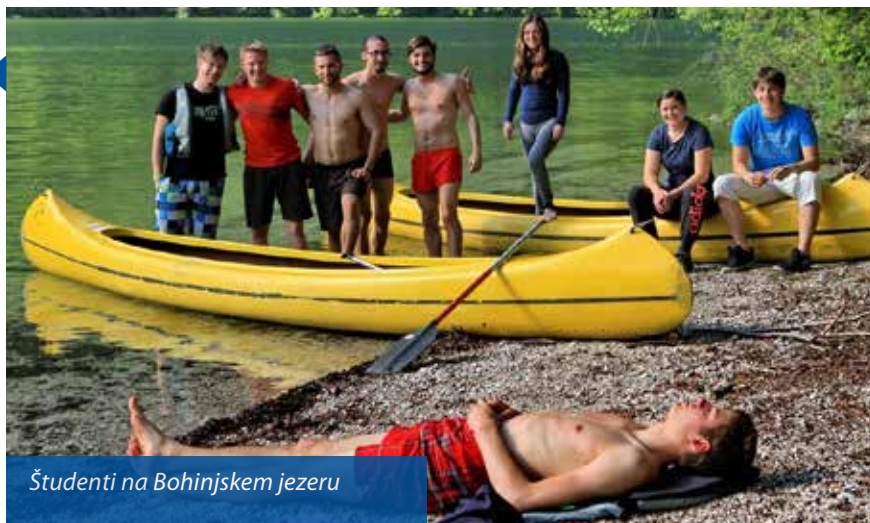
Študenti na Bohinjskem jezeru

|| 23.–25. 5. smo sodelovali na Sejmu akademske knjige Liber.Ac na Foersterjevem vrtu ob Filozofski fakulteti v Ljubljani. Predstavili smo se s stojnico z našimi knjižnimi izdajami. Ob sejmu vedno poteka tudi spremljevalni program (več na http://www.ff.uni-lj.si/knjige/Liberac/Liberac_2017 ).